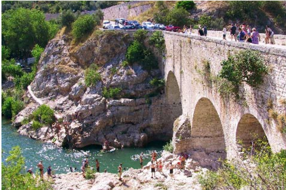
Baignade au Pont du Diable

Si les autorisations sont délivrées : - la consultation des entreprises devrait se réaliser début 2007 ; - les travaux pourraient débuter au premier semestre 2007.