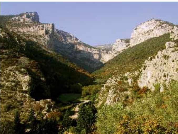
Le cirque de l'Infern et les monts de St-Guilhem