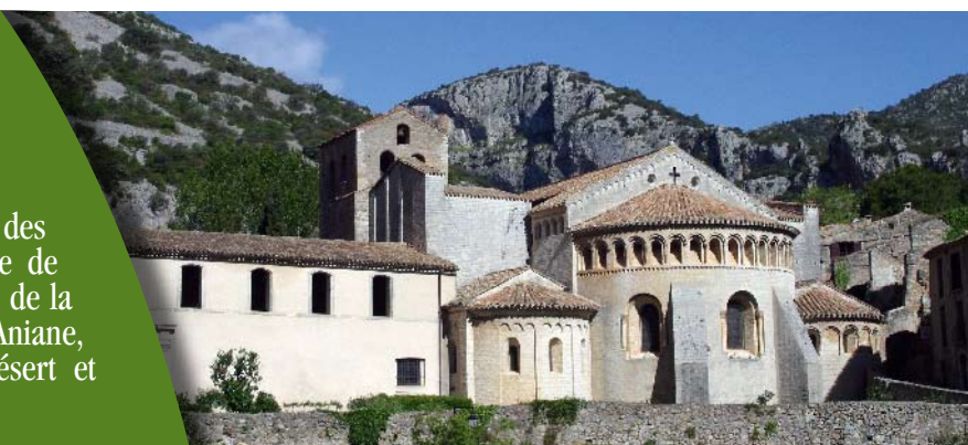
L'abbaye de Gellone, Saint-Guilhem-le-Désert