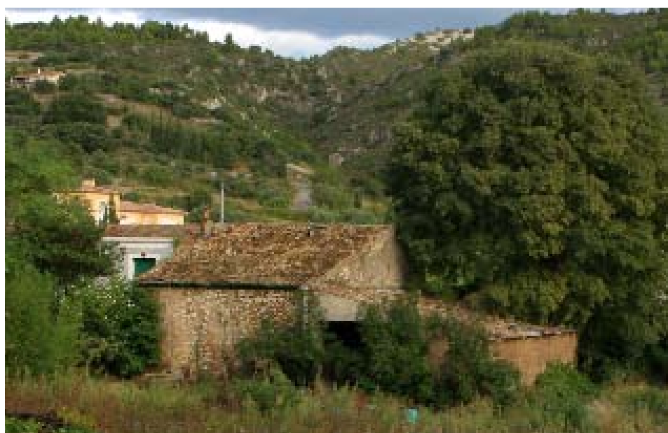
La maison Sabadel à Saint-Jean-de-Fos

A terme, la commune de St-Jean-de-Fos disposera d'un lieu de découverte et d'animation entièrement dédié à l'artisanat qui fait sa renommée, avec :