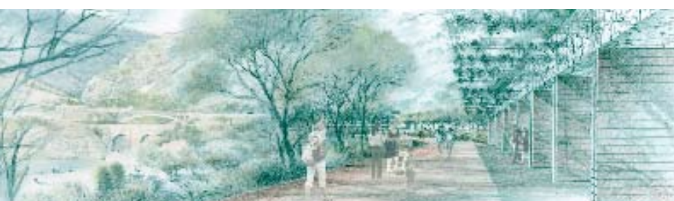
Vue depuis la Maison du site

Le cheminement vers le Pont du Diable depuis les stationnements est en situation de balcon sur la vallée de l'Hérault. Une passerelle indépendante de la RD27 affirme la volonté d'autonomie du chemin et protège le visiteur des nuisances de la route. L'ouvrage est léger et élégant, il s'inscrit en harmonie avec la végétation. La RD27, quant à elle, est déplacée vers l'est sur environ 280 mètres.