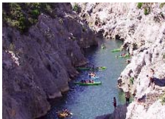
Canoë sous le Pont du Diable

Le schéma de gestion des APN devrait donc permettre d'éviter la détérioration des espaces et les conflits d'usage ; il constitue également un moyen de valorisation et de développement du territoire par les sports de pleine nature.