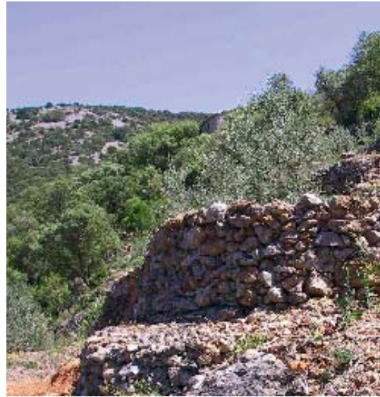
Les terrasses restaurées de la combe de Carrelles

Les producteurs d'olives de la commune se sont regroupés, avec le soutien de la mairie, pour créer une huile d'olives des terrasses de Saint-Guilhem-le-Désert. L'association « Terrasses de Gellone » (ATG) a été créée fin novembre 2005 pour porter ce projet et, plus largement, pour promouvoir les productions agricoles et les savoir-faire locaux. Cette première huile, qui devrait sortir en faible quantité, sera présentée à tous au printemps prochain.