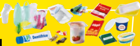
Tous les autres emballages en plastique (pots, barquettes, films, sacs, suremballages..).