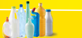
Bouteilles et flacons en plastiques Bien vidés, avec les bouchons.