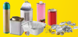
Emballages en métal, même petits.