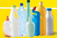
Bouteilles et flacons en plastiques Bien vidés, avec les bouchons.