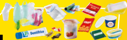
Tous les autres emballages en plastique (pots, barquettes, films, sacs, suremballages...).