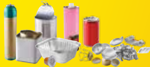
Emballages en métal, même petits.