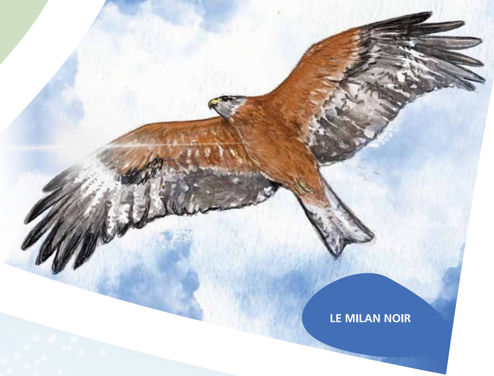
LE MILAN NOIR