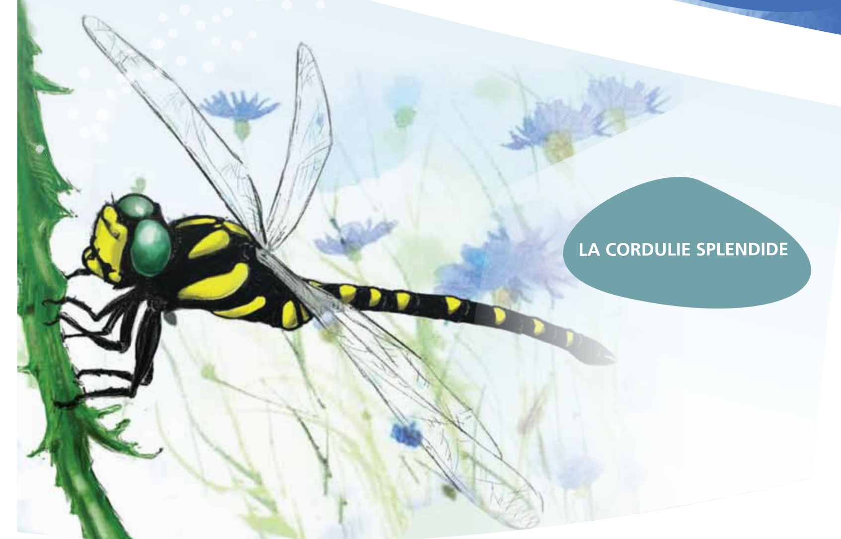
LA CORDULIE SPLENDIDE