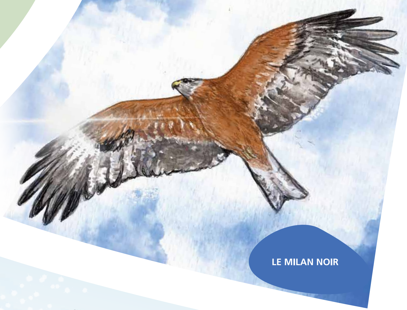
LE MILAN NOIR