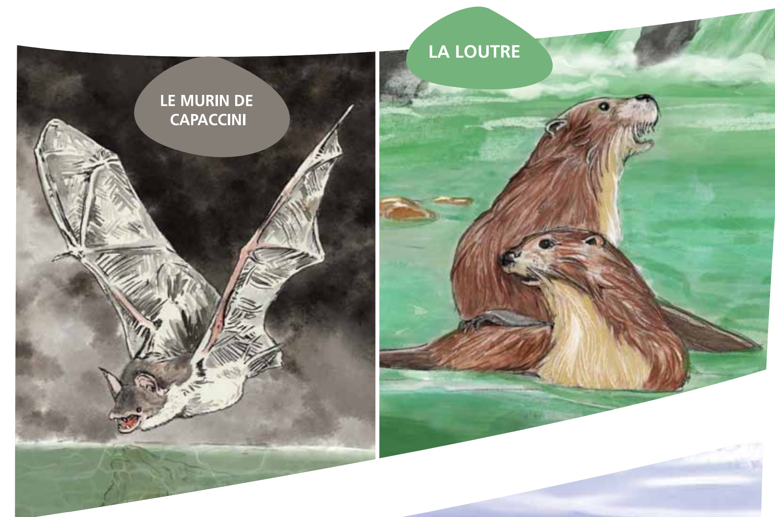
LE MURIN DE CAPACCINI