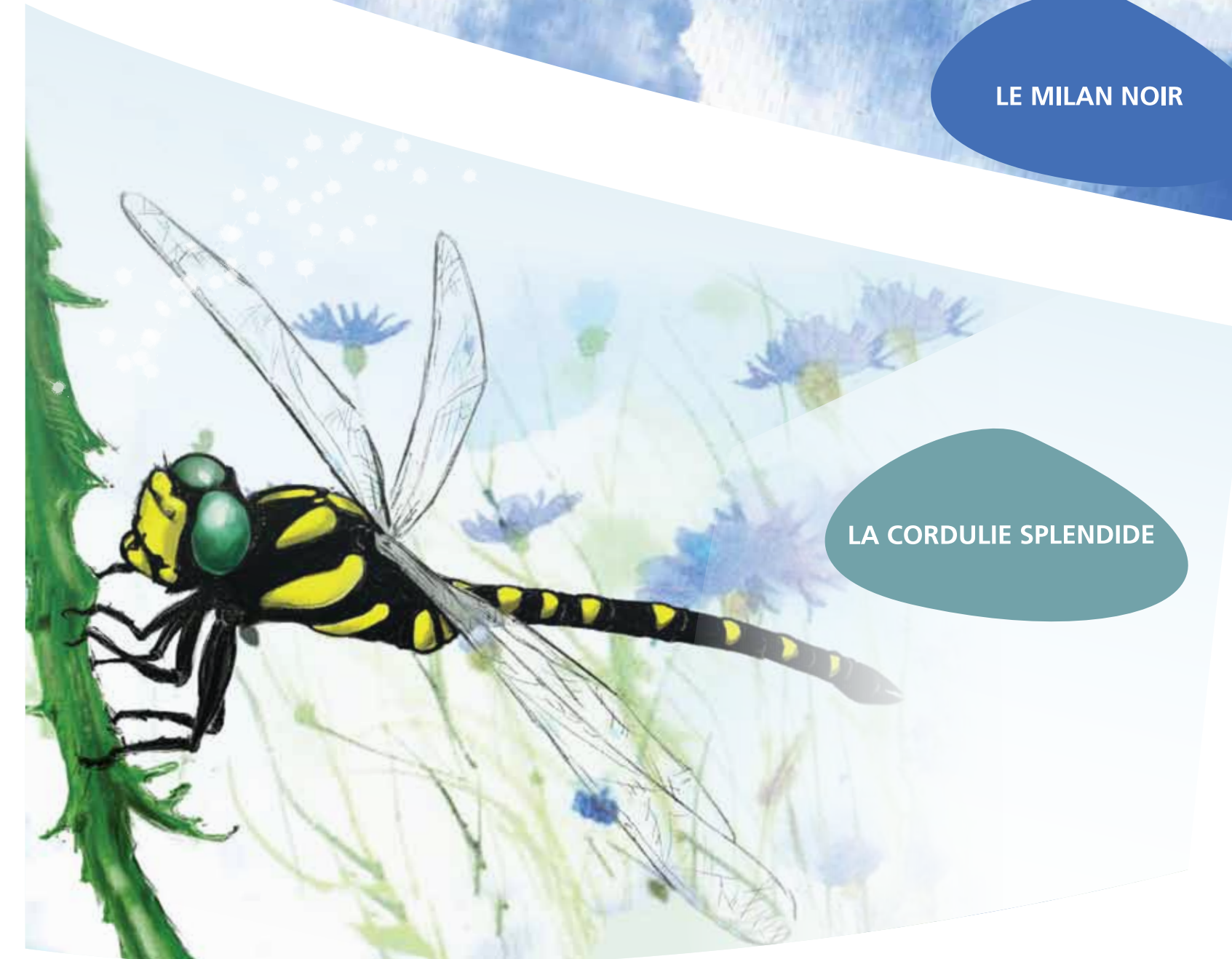
LA CORDULIE SPLENDIDE