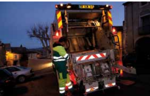
Une gestion des déchets de qualité