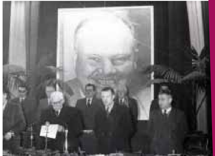
Etienne Fajon (au centre) à la conférence nationale du PCF en 1953

Des hommes et des femmes, natifs de la Vallée de l'Hérault ou tout simplement de passage, ont marqué notre histoire et exercé une certaine influence sur leurs concitoyens et les générations qui leur ont succédé. A l'entour vous propose donc de découvrir l'itinéraire de l'une de ces « figures » qui ont marqué leur époque, Etienne Fajon.