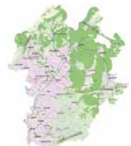
Développer des outils pour anticiper l'évolution du territoire

Cela consistera notamment à procéder à l'achat de matériel et logiciel pour la collectivité et les communes, à numériser les réseaux d'eau potable et d'assainissement, et d'autre part à contribuer à la mise en place du haut-débit sur le territoire.