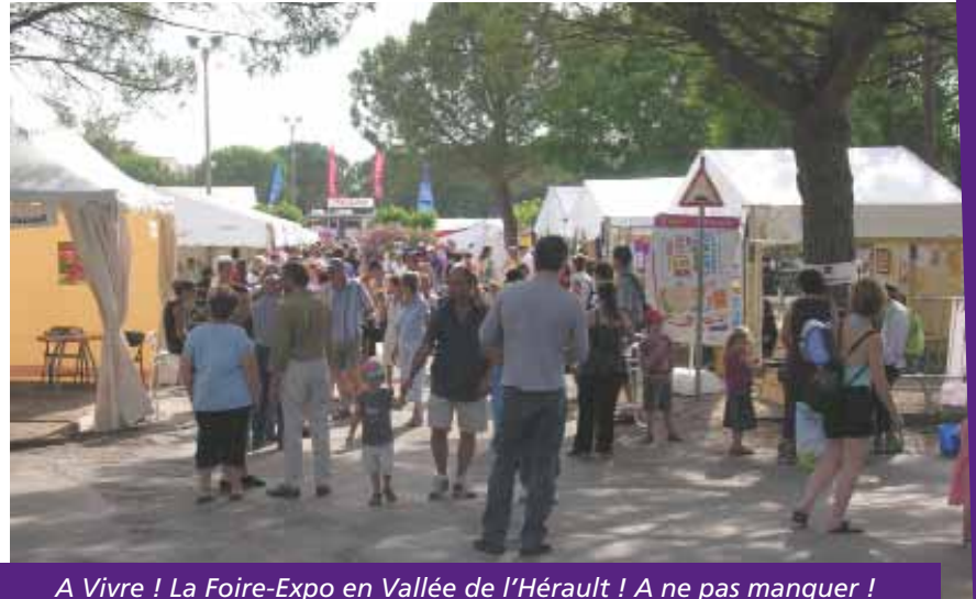
A Vivre ! La Foire-Expo en Vallée de l'Hérault ! A ne pas manquer !

Découverte, émerveillement, rencontres improbables et surprenantes vous attendront au détour des allées du village de chapiteaux qui sera installé pour l'occasion, à l'espace cultu-