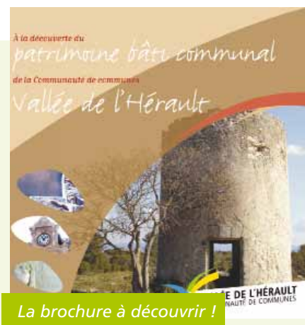
La brochure à découvrir !

Suite à un travail de longue haleine d'inventaire du patrimoine bâti, non protégé et public sur les 28 communes de la Vallée de l'Hérault, votre communauté de communes va éditer un document présentant les éléments les plus remarquables qui ont pu être recensés. Qu'il s'agisse de patrimoine hydraulique, religieux, défensif ou artisanal, cette brochure vous offre un panorama de la richesse de notre territoire dans ce domaine.