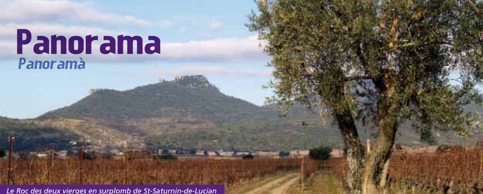
Le Roc des deux vierges en surplomb de St-Saturnin-de-Lucian