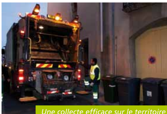
Une collecte efficace sur le territoire

www.cc-vallee-herault.fr/lecture-publique ■