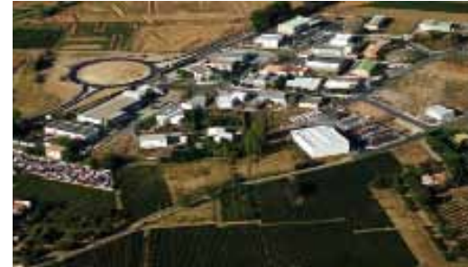
Le parc d'activités «La Garrigue» bientôt requalifié