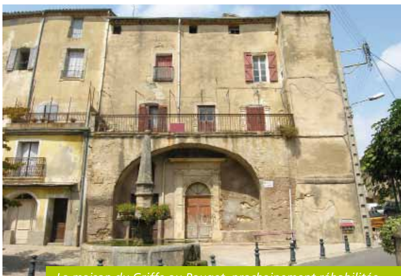
La maison du Griffon au Pouget, prochainement réhabilitée

Dans le cadre de son règlement d'aides relatif au Programme Local de l'Habitat (PLH), la Communauté de communes Vallée de l'Hérault peut être sollicitée pour intervenir en appui des communes pour des projets d'acquisitions foncières à vocation de logement social. C'est dans ce contexte que la mairie du Pouget a exprimé sa volonté d'acquiescer la maison du Griffon.