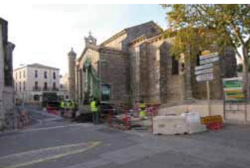
Le centre urbain du Pouget en travaux