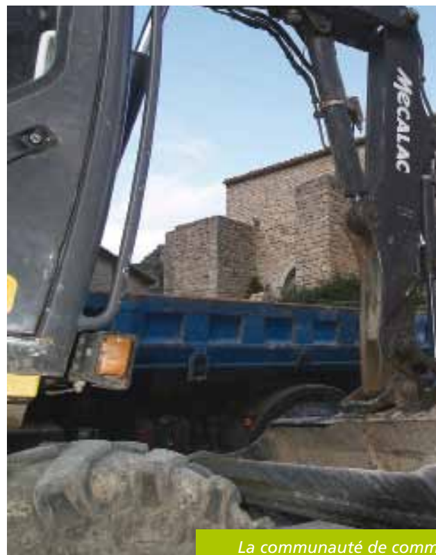
La communauté de comm

Cette opération de travaux a démarré au mois d'octobre 2008. Les premiers aménagements consistent à mettre en œuvre un réseau enterré de récupération des eaux pluviales et de remplacer l'ensemble du réseau d'amenée de l'eau potable sur la totalité de l'emprise de l'opération. Cette première phase, en cours de finalisation, sera suivie par la requalification de l'ensemble de l'espace public : création d'espaces trottoirs accessibles