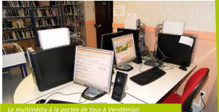
Le multimédia à la portée de tous à Vendémian

Passé un premier temps de formation des personnels au logiciel documentaire, les lecteurs de ces