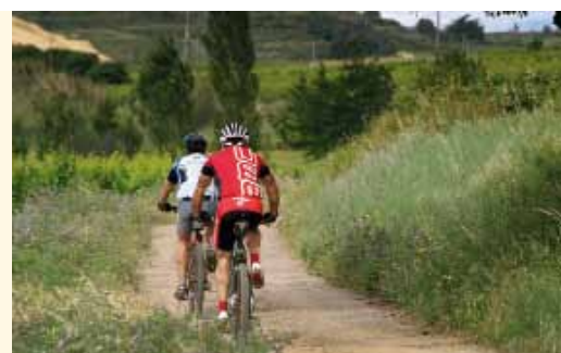
Des actions conjuguées pour protéger et mettre en valeur notre territoire