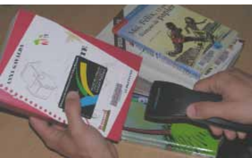
Un réseau innovant en Vallée de l'Hérault