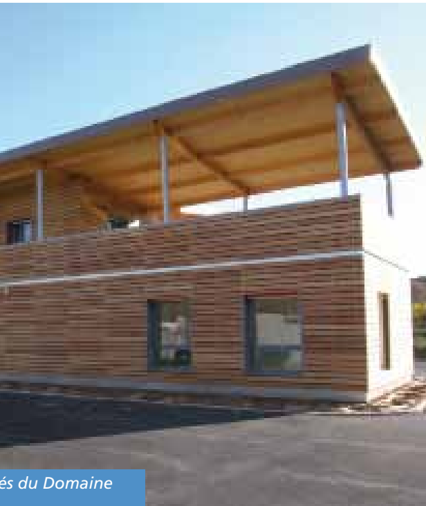
és du Domaine