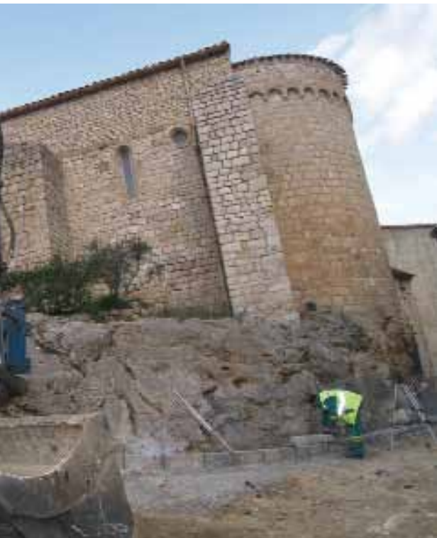
Travaux au rendez-vous de la modernisation du territoire