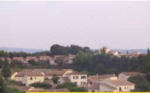
Accompagner l'offre de logements