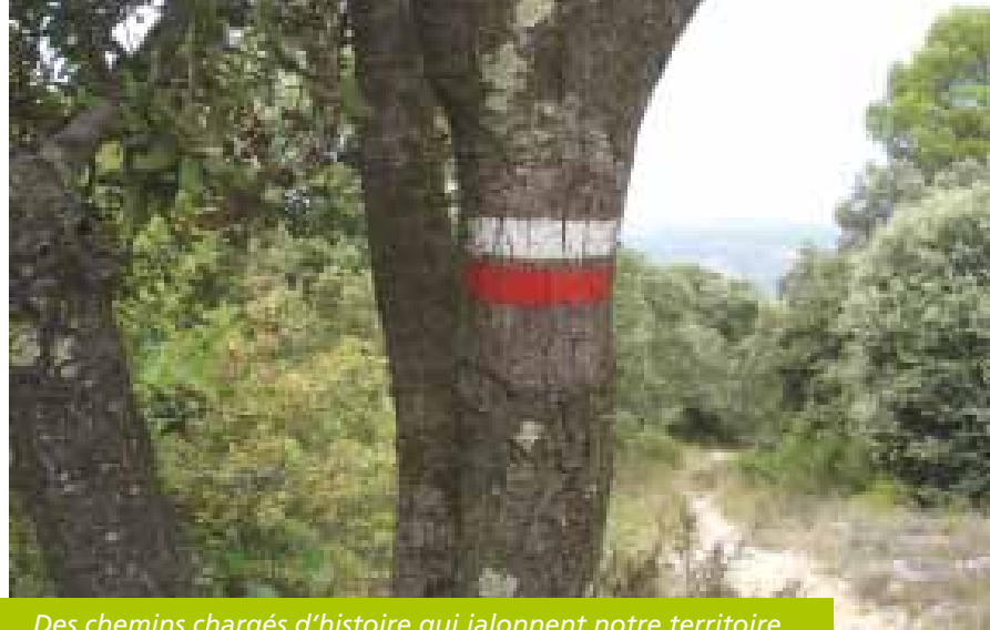
Des chemins chargés d'histoire qui jalonnent notre territoire