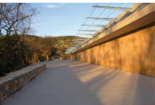
La maison du grand site presque achevée

Afin de compléter un peu plus le dispositif, une Maison de la Poterie sera créée sur la commune de St-Jean-de-Fos.