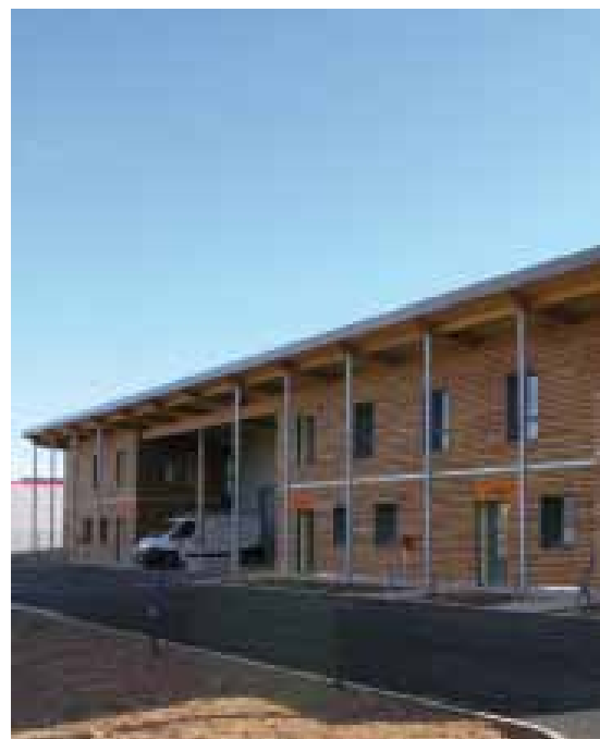
Le nouvel hôtel d'entreprises du parc d'activités de Trois Fontaines au Pouget