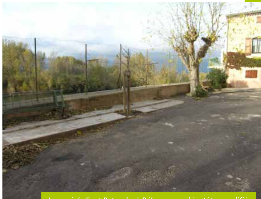
Le quai de Font Petourle, à Bélarga, sera bientôt requalifié

Au-delà des travaux nécessaires pour réparer les dégradations liées aux temps, cette requalification a pour objectif d'aménager un espace convivial pour les habitants, qui soit aussi un point de vue sur le fleuve pour les visiteurs. Pour ce faire, les revêtements de surface seront refaits, de même que les réseaux d'eau potable et d'eaux usées. L'éclairage public sera amélioré, et l'actuel mur-parapet remplacé par un muret intégrant des bancs. Enfin, le réaménagement paysager de l'espace viendra clôturer ces travaux qui débuteront à la fin de l'année 2011. Ils prendront fin aux premiers jours du printemps.