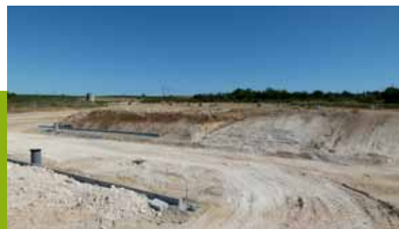
Les lots du parc d'activités de la Tour à Montarnaud sont à la vente.

Ils se trouvent à proximité immédiate de la sortie d'autoroute (A750) et la RN109, permettant aux entreprises de toucher à la fois l'agglomération Montpelliéraine, et les bassins de vie du cœur d'Hérault. Les artisans, commerçants, et entrepreneurs intéressés peuvent contacter le service Développement économique, au 04 67 57 04 50.