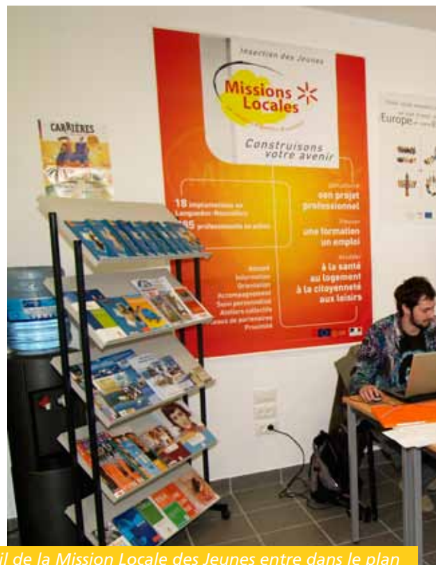
Le travail de la Mission Locale des Jeunes entre dans le plan d'actions de la politique enfance-jeunesse

En début d'année, la communauté de communes a lancé une étude afin de dresser un état des lieux de l'enfance - jeunesse en vallée de l'Hérault. Les grandes orientations du futur plan se dessinent.