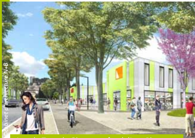
Avec la Tour de Gignac en fond, l'axe Pierre Mendès - France deviendra un mail commercial

Ainsi, pendant un mois, les personnes intéressées auront le dossier complet à disposition à la mairie, et pourront au choix laisser un commentaire sur le registre prévu à cet effet, ou rencontrer le commissaire enquêteur lors de l'une de ses permanences, dont les dates seront communiquées sur le site web de la