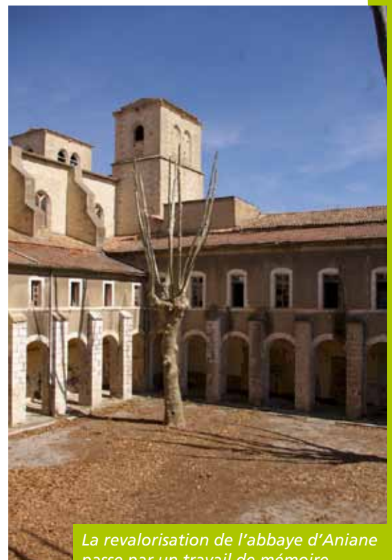
La revalorisation de l'abbaye d'Aniane passe par un travail de mémoire

Travail de mémoire et passage de témoins, passerelles artistiques au croisement de la recherche, autant de démarches participant à établir les bases d'un projet culturel global, inscrit dans le projet de revalorisation de l'abbaye d'Aniane. ■