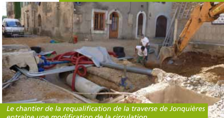
Le chantier de la requalification de la traverse de Jonquières entraîne une modification de la circulation.

Les déviations et le plan de circulation restent donc inchangés jusqu'au premier trimestre 2012.