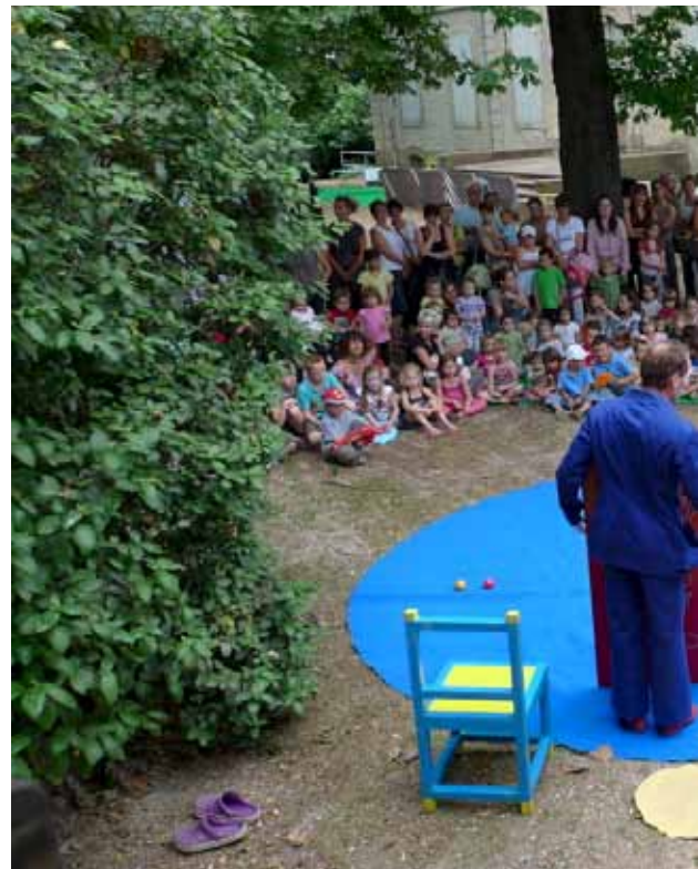
L'inauguration du Relais Assistants Maternels, au mois de juin dernier, a rencontré un franc succès

Première action concrète après la prise de compétence enfance-jeunesse, le RAM fête son premier anniversaire.