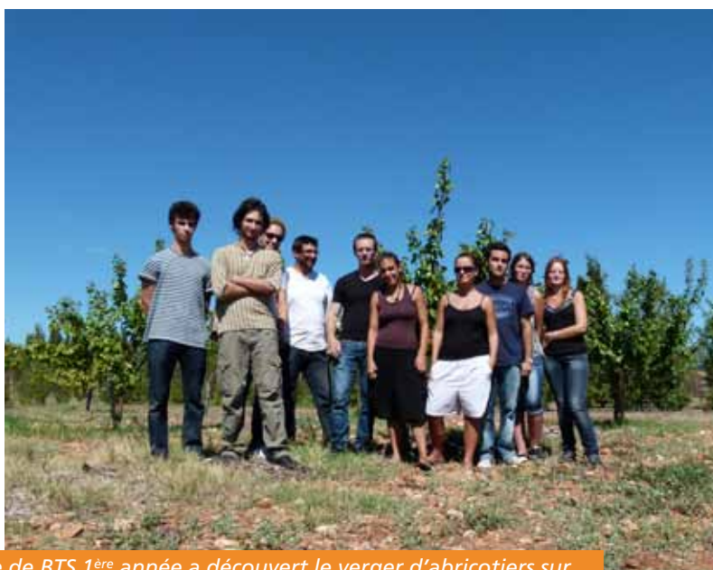
La classe de BTS 1 ère année a découvert le verger d'abricotiers sur lesquels ils vont mener les tests.

Les élèves de BTS horticulture du Lycée agricole de Gignac et le Syndicat Centre Hérault travaillent ensemble pour valoriser le compost et le bois de paillage.