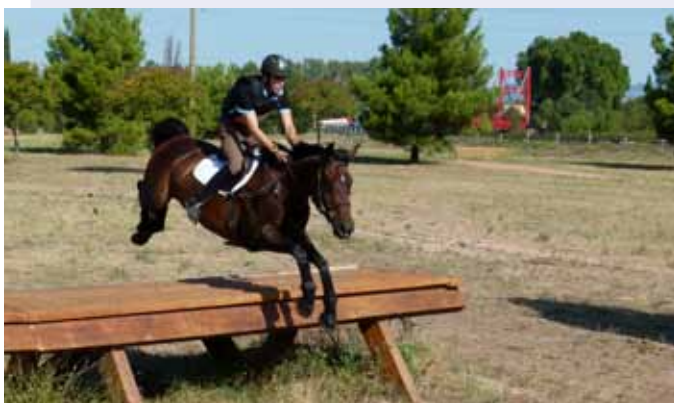
La table sera au menu du parcours de cross

La communauté de communes soutient l'initiative du Domaine équestre des Trois Fontaines, au Pouget, qui organise son premier Concours Complet d'Équitation International ! Discipline spectaculaire de l'équitation, le concours complet se court sur trois épreuves : chacun des cavaliers devra réaliser une reprise de dressage, un parcours de saut d'obstacle et un parcours de