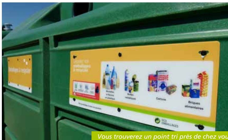
Vous trouverez un point tri près de chez vous

Enfin, les médicaments doivent être portés en pharmacie, les vêtements et autres objets encore utilisables peuvent être portés à des associations caritatives. Les déchets, à chacun sa filière ! ■