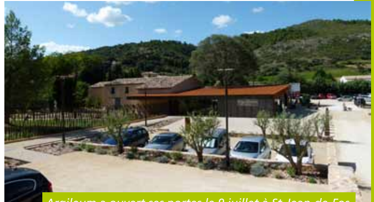
Argileum a ouvert ses portes le 9 juillet à St-Jean-de-Fos

Les points d'accueil de l'Office de Tourisme Intercommunal*** St-Guilhem-le-Désert - Vallée de l'Hérault ont par ricochet enregistré de fortes fréquentations