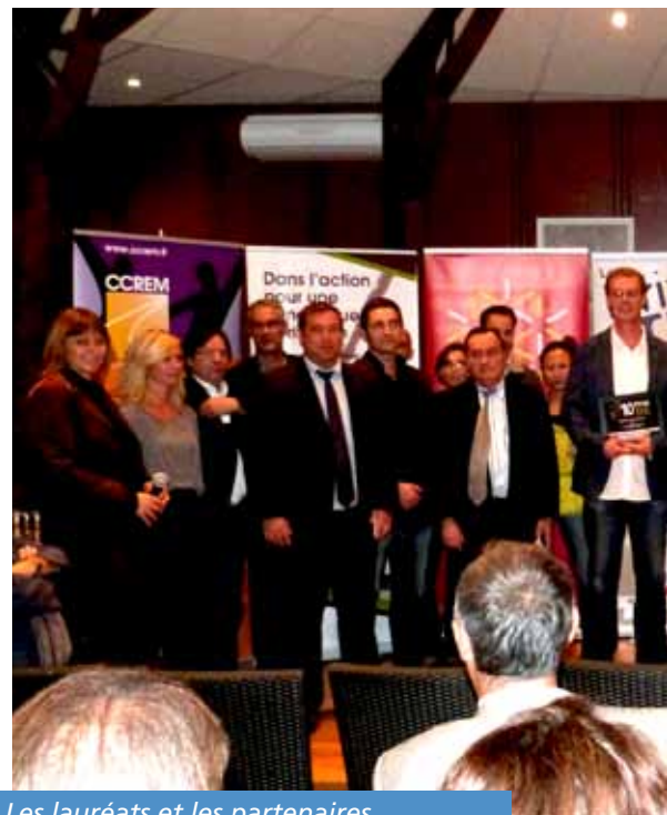
Les lauréats et les partenaires institutionnels lors de la remise des prix