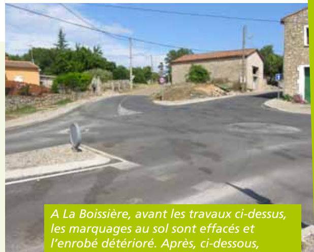
A La Boissière, avant les travaux ci-dessus, les marquages au sol sont effacés et l'enrobé détérioré. Après, ci-dessous, les trottoirs ont été améliorés, des plateaux traversants et des cheminements piétonniers créés pour plus de sécurité.

Les travaux lancés autour de l'aménagement du lotissement des Aires à Pouzols ont été scindés en deux temps. Pour la première étape, qui s'est déroulée de novembre 2011 à février 2012, l'objectif était de renouveler et renforcer les réseaux d'eaux potable et usées. La seconde tranche des travaux porte sur l'aménagement de la rue des Crémades, par laquelle se fera l'accès au futur lotissement avec la création de nouveaux espaces publics. Le Conseil Général de l'Hérault et l'Agence de l'eau ont apporté leur contribution à ce projet. ■