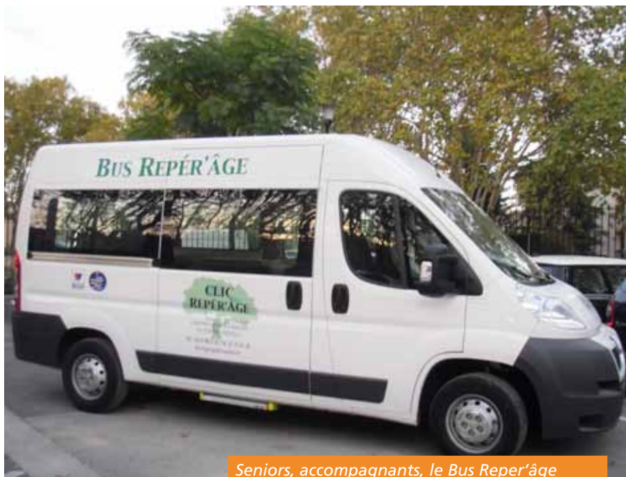
Seniors, accompagnants, le Bus Reper'âge vous attend dans les communes du territoire !

Le Centre Local d'Information et de Coordination Gérontologique (le CLIC) vient à la rencontre des personnes âgées dans les villages.