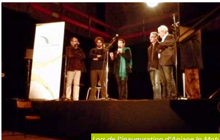
Lors de l'inauguration d'Aniane In Motus