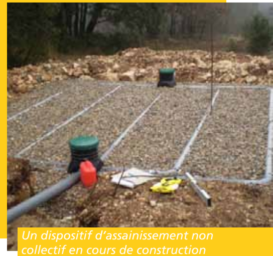
Un dispositif d'assainissement non collectif en cours de construction

Consciente du poids financier et de la complexité de ces travaux, la communauté de communes a lancé en 2010 un programme de réhabilitation. Ce dernier permettait aux habitants qui y participaient de bénéficier d'une part d'une aide financière de l'Agence de l'eau, et d'autre part, de contacts privilégiés avec des entreprises spécialisées dans ce domaine. Ainsi, les travaux sont en cours pour 45 installations du territoire. Ce sont autant de dispositifs qui rejeteront désormais une eau traitée dans les normes.