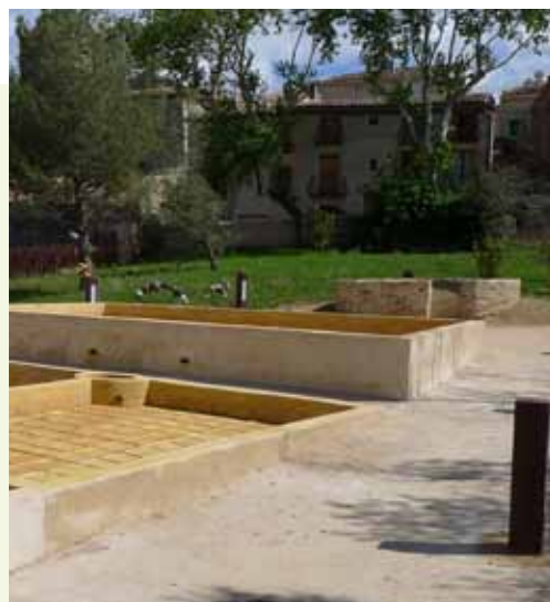
Autour des bassins de décantation de l'argile restaurés, des jardins vont être aménagés

Réouverture d'Argileum - la maison de la poterie dès le 13 avril.