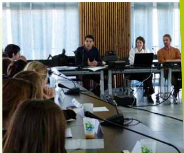
Le 30 janvier dernier, lors du premier éco-parlement

Au programme de cette première session, l'apprentissage de ce qu'est un éco-délégué et de ses fonctions par le jeu. « Présente ton voisin », ou encore « un match de boxe canadienne » ont permis aux jeunes d'apprendre à prendre la parole, à rendre compte d'une information, ou encore à argumenter pour défendre leur point de vue. Et lorsque l'on demande à ces apprentis quelles sont les qualités d'un bon éco-délégué, les réponses fusent : « nous devons parler au nom de notre classe », « on doit savoir écouter », ou encore « nous devons être curieux ». Qui sait si, d'ici quelques années, l'un d'entre eux n'occupera pas un siège de délégué communautaire dans cette même salle ?