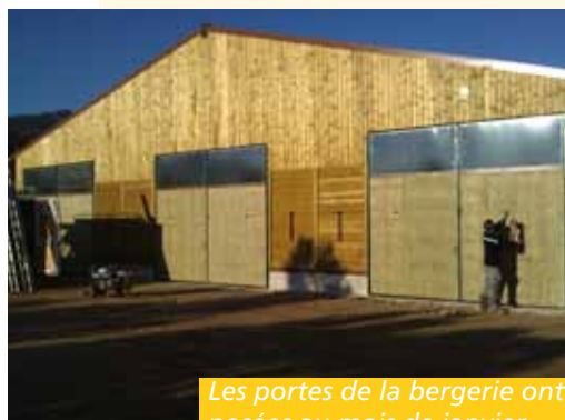
Les portes de la bergerie ont été posées au mois de janvier

Tout cela contribue aussi à conserver la riche biodiversité des milieux ouverts. C'est grâce à ses paysages agro-pastoraux qu'une partie du territoire de la vallée de l'Hérault (Montpeyroux et St-Guilhem-le-Désert) fait partie du bien « Causses et Cévennes » classé au patrimoine mondial de l'UNESCO. ■