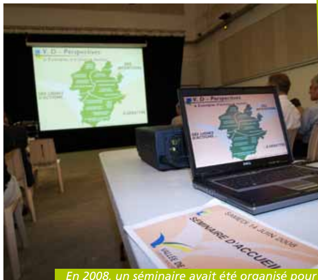
En 2008, un séminaire avait été organisé pour présenter le projet de territoire à l'ensemble des conseillers communautaires

Au-delà de la concertation et des objectifs de développement durable qui devront être respectés pour obtenir une labellisation Agenda 21 en 2014, ce nouveau projet de territoire devra prendre en compte les stratégies du Pays Cœur d'Hérault, dont fait partie la communauté de communes, ainsi que le Schéma de Cohérence Territoriale en cours d'élaboration (SCOT). Autant de plans qui permettront à notre territoire de se développer en bonne intelligence avec les territoires voisins. ■