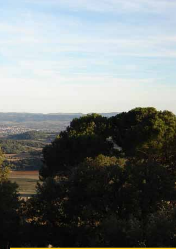
Les paysages, témoins de la bonne santé de l'environnement de la vallée de l'Hérault

Rendez-vous incontournable de la saison à la maison du Grand Site, la fête de la nature se tiendra le dimanche 26 mai. La recette reste inchangée : toute la journée, de nombreuses animations sensibiliseront petits et grands à la belle nature qui les entoure au pont du Diable. Notez d'ores et déjà le thème de cette année : les sales petites bêtes ! Ces animaux que nous craignons rendent pourtant d'importants services écologiques et ne sont pas si dangereux que ce que nous croyons. Retrouvez le programme complet de la manifestation dès le printemps sur le site : www.saintguilhem-valleeherault.fr