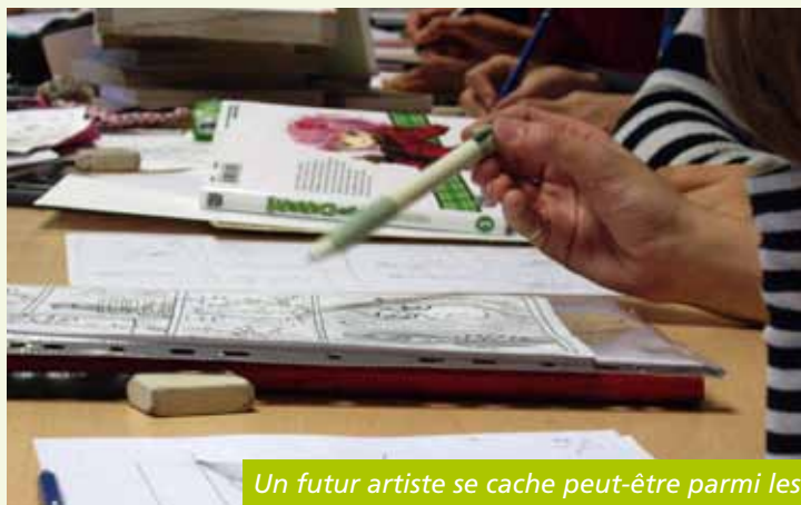
Un futur artiste se cache peut-être parmi les adolescents qui ont participé à ces ateliers