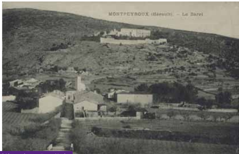
début du XX ème siècle

Quant au Castellàs lui-même, il a beaucoup évolué. Apparu dans le dernier tiers du 11 ème siècle, il accueille une résidence aristocratique fortifiée. Tandis qu'il abrite plus de 150 structures dans les années 1500, le site se vide peu à peu, jusqu'à être déserté après 1630. On remarque au centre la présence d'un bâtiment datant du milieu du 19 ème siècle. A vocation religieuse au début de sa construction en 1863, il est devenu un orphelinat en 1887. Il est ensuite détruit par dynamitage en 1919. Un élément qui nous permet de mieux situer la période à laquelle a été prise la carte postale. ■