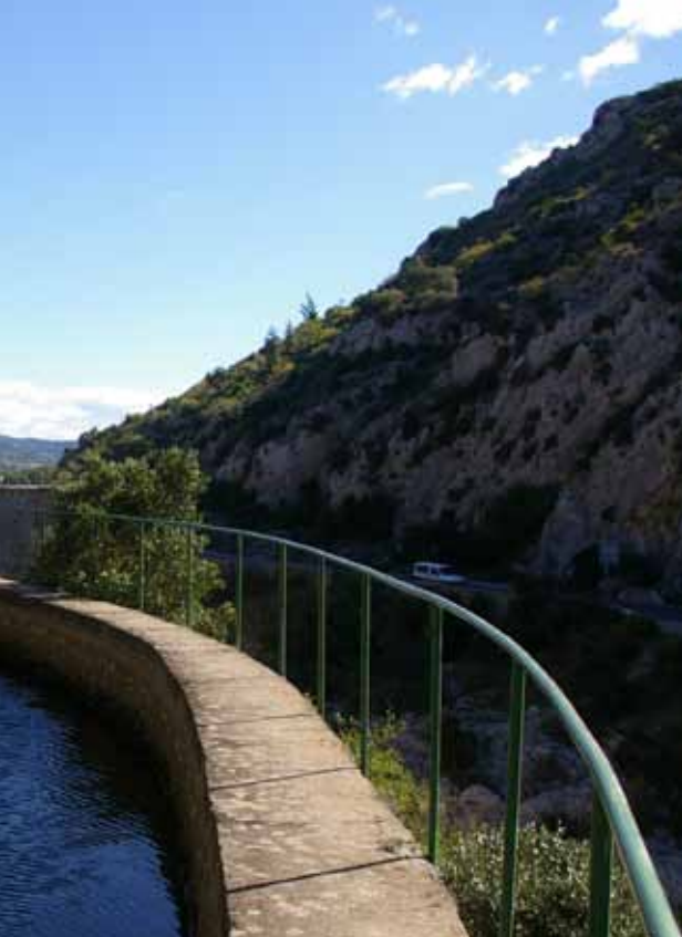
Le canal de Gignac, peu avant le pont du Diable