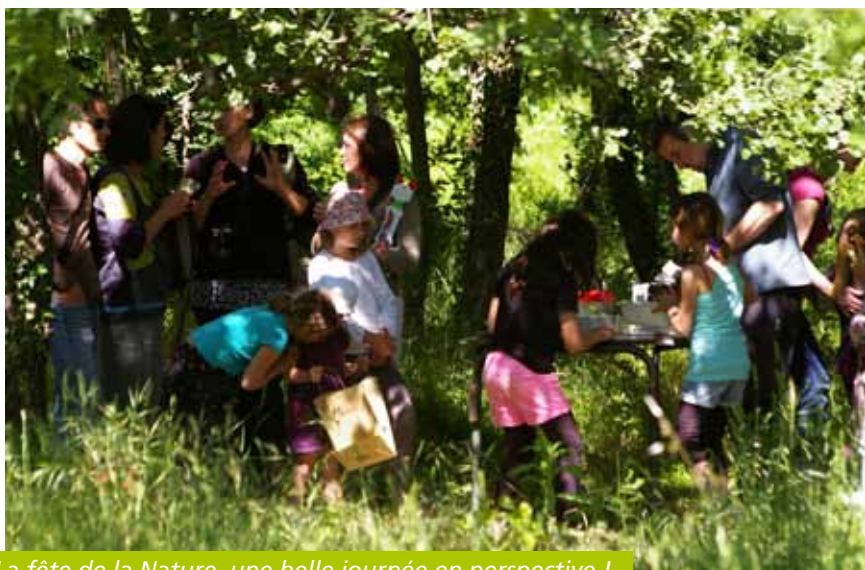
La fête de la Nature, une belle journée en perspective !

Forte d'un succès croissant, la fête de la Nature revient les 24 et 25 mai 2014 !