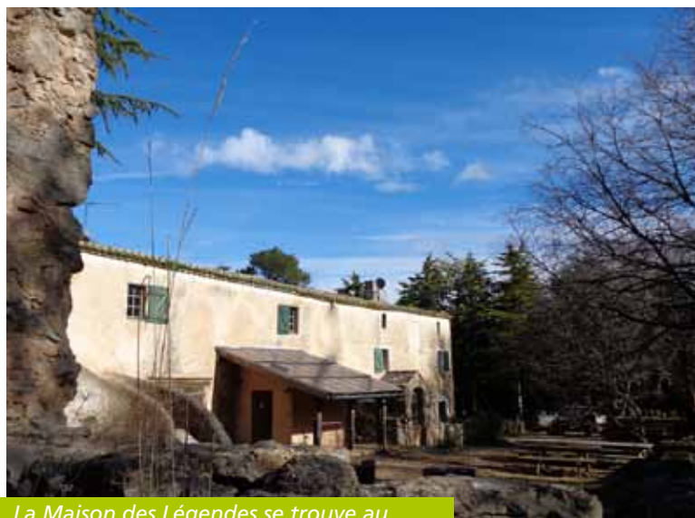
La Maison des Légendes se trouve au cœur de la forêt domaniale de St-Guilhem

A découvrir dès le 27 juin pour la première « Nuit des légendes ».