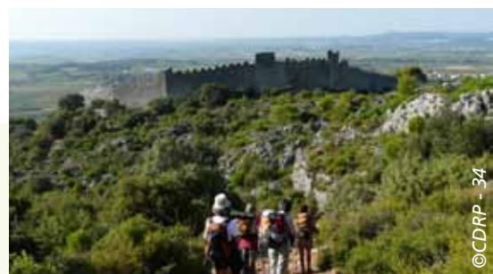
L'arrivée sur le castellas de Montpeyrroux

Retrouvez toutes les rando-fiches dans les points d'accueil de l'Office de Tourisme Intercommunal, à Gignac, à la maison du Grand Site de France et à St-Guilhem-le-Désert.