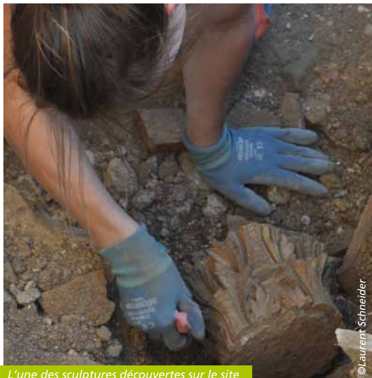
L'une des sculptures découvertes sur le site

A quoi pouvait bien ressembler l'abbaye d'Aniane des grandes années, de sa fondation jusqu'au début du 16 ème siècle ? Les traces écrites font état d'un centre économique de grande importance, comprenant des terres, des villages, des mas, ainsi qu'une bibliothèque de grande réputation, et duquel de nombreux religieux sont partis pour unifier les pratiques monastiques dans toute la France. On le sait aujourd'hui, la règle bénédictine s'est alors si bien répandue que Louis le Pieux a commandé à St-Benoît d'Aniane de venir le rejoindre à Aix-la-Chapelle, qui était alors la capitale de l'Empire.