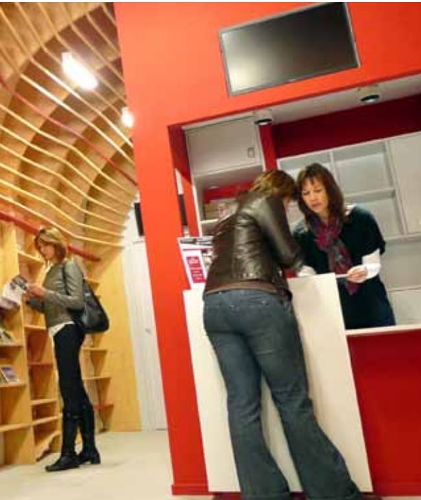
Bornes interactives et conseillers en séjour se complètent dans le nouveau point d'accueil de l'Office de Tourisme Intercommunal à St-Guilhem-le-Désert

bornes. Un accès au Wifi sera ouvert (en durée limitée), et le site web de l'Office de Tourisme Intercommunal sera décliné dans une version optimisée pour les mobiles. De quoi répondre au mieux aux visiteurs, que l'on attend nombreux. On estime en effet que ce nouvel emplacement, plus central dans le village, devrait multiplier par trois la fréquentation de l'Office de Tourisme. Les excursionnistes venus découvrir les monts de St-Guilhem en feront très certainement partie. Ils trouveront un espace boutique à leur image, avec un espace dédié à la randonnée.