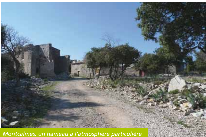
Montcalmes, un hameau à l'atmosphère particulière

La Communauté de communes Vallée de l'Hérault et la commune de Puéchabon travaillent sur le projet de valorisation du plateau de Montcalmès.