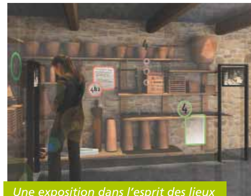
Une exposition dans l'esprit des lieux

A la suite du concours de maîtrise d'oeuvre en cours, un nouveau projet architectural sera retenu. La Maison de la Poterie verra le jour courant 2011. ■