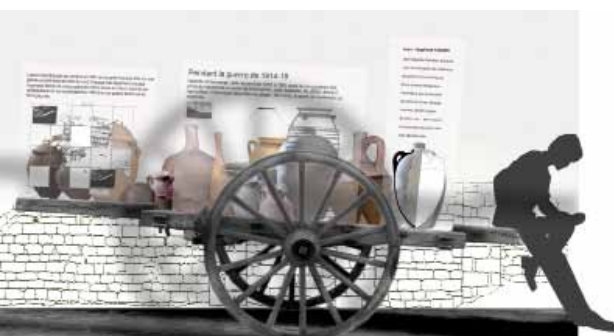
Une collection aux nombreux souvenirs

Plusieurs inventaires ont été menés au sein de l'atelier Sabadel, dont les nombreuses pièces ont également enrichi la collection municipale de St-Jean-de-Fos. Un premier travail de collecte, en 1975, avait permis de recueillir 130 pièces auprès de tous les habitants du village, regroupant aussi bien de l'outillage potier, du matériel d'en-