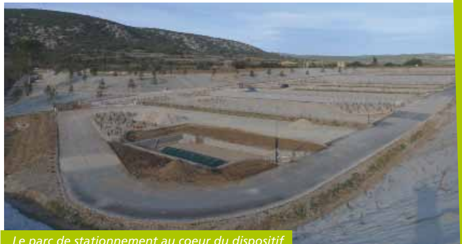
Le parc de stationnement au coeur du dispositif

Les tarifs de l'aire de stationnement resteront abordables : 3 euros pour la journée pendant la période estivale du 15 juin au 14 septembre, 1 euro le reste de l'année. Les riverains auront la possibilité de bénéficier d'un abonnement particulier. ■