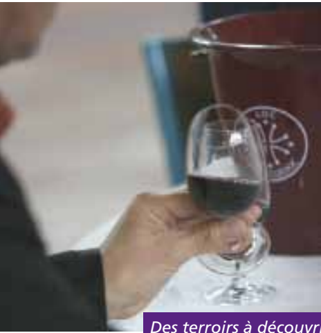
Des terroirs à découvrir !

Au sein de la maison du grand site, parmi les différents espaces thématiques, vous pourrez découvrir l'espace « vînothèque ».