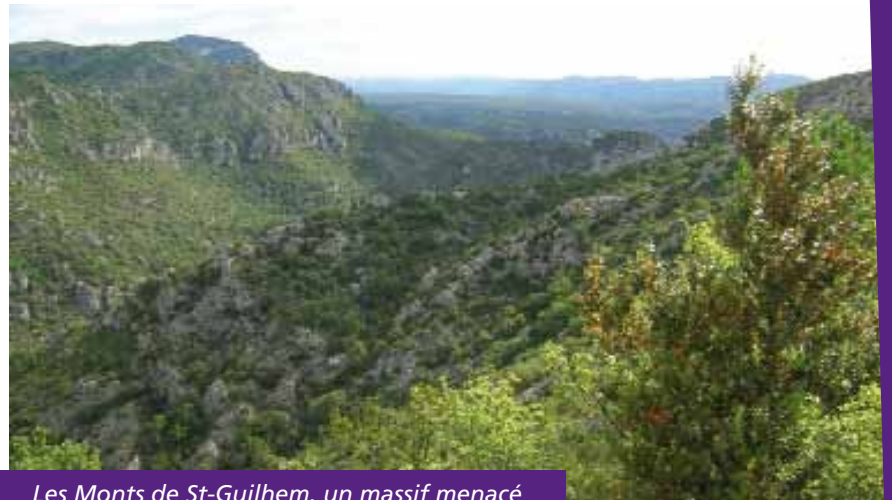
Les Monts de St-Guilhem, un massif menacé

Les monts de St-Guilhem et le massif de la Séranne constituent un milieu fragile, exposé à des risques d'incendie importants. Ce « poumon vert » de la Vallée de l'Hérault, composé d'essences rares (comme le pin de Salzman) et d'une faune riche, représente un véritable enjeu pour sa préservation. C'est pourquoi différents acteurs (ASA de la Séranne, ONF, Chambre d'agriculture, Service d'Utilité Agricole Montagne Méditerranéenne Élevage et Communauté de communes Vallée de l'Hérault) se sont associés en 2008 dans le cadre d'une Opération Concertée d'Aménagement et de Gestion de l'Espace Rural (OCAGER),