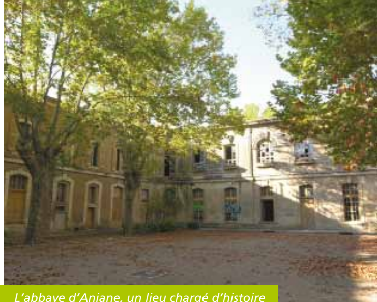
L'abbaye d'Aniane, un lieu chargé d'histoire

La Communauté de communes Vallée de l'Hérault et la commune d'Aniane ont débloqué la situation de ce patrimoine laissé à l'abandon par les services du Ministère de la Justice, afin de préserver et valoriser l'ensemble abbatial dans le cadre de l'Opération Grand Site «St-Guilhem-le-Désert – Gorges de l'Hérault»