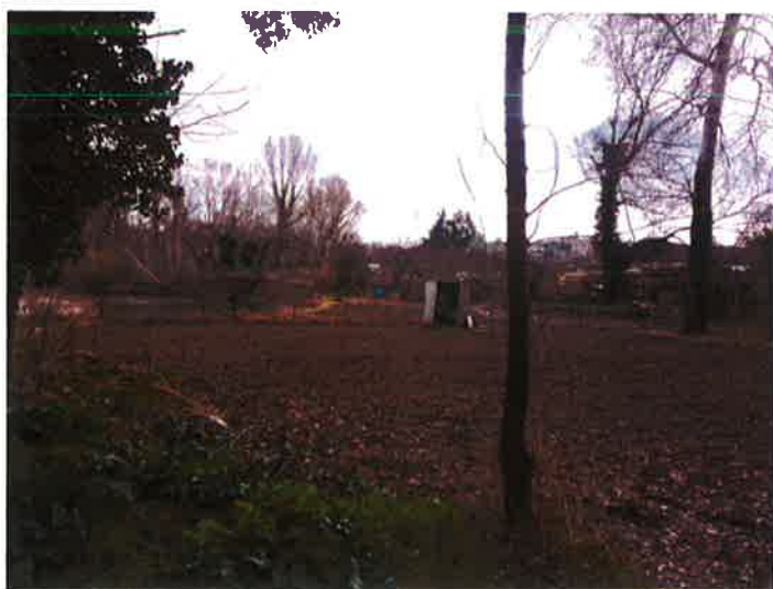
Anse d'érosion sous les jardins potagers en RD – Brignac