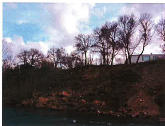
Erosion de berge sous le camping de Canet