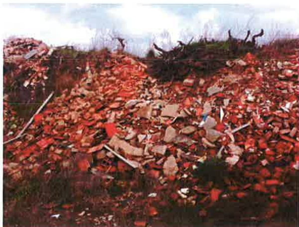
Dépôt de gravas en RG Saint-André de Sangonis