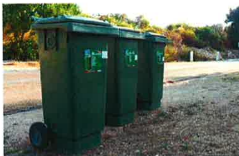
Les bacs verts destinés à la collecte de biodéchets

Depuis cette année, en plus de l'étiquetage habituel, les bacs nouvellement acquis sont gravés « CC VALLEE DEL'HERAULT » de façon à pallier à la disparition des étiquettes (cette opération est comprise dans le marché sans surcoût) et reconnaître ainsi les bac appartenant à la collectivité.