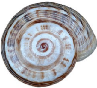
Vue de dessus

Nous pouvons les trouver dans tous types d'habitats (jardins, forêts, garrigues, mares, ruisseaux, fleuve...). Actuellement, 39 espèces ont été renseignées sur iNaturalist sur le territoire de la vallée de l'Hérault. Cette enquête permettra de mieux connaître la répartition des espèces dont certaines sont menacées comme les Bythinella et d'autres protégées comme l' Otala de Catalogne. Les escargots et limaces sont des mollusques que l'on peut trouver sous les pierres, planches, souches de bois ou dans les fissures des murs et falaises.