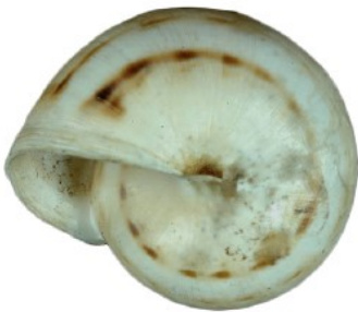
Vue de dessous