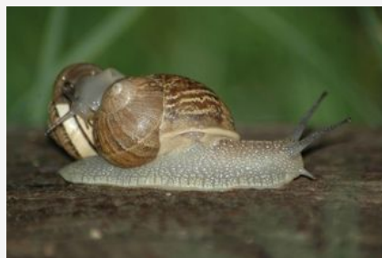
Petit gris

Dans le cadre de l'atlas de la biodiversité porté par la Communauté de communes Vallée de l'Hérault avec le soutien de l'Office français de la biodiversité, des enquêtes et des animations sont régulièrement proposées aux habitants du territoire. La quatrième enquête porte sur les mollusques du territoire. Elle va se dérouler jusqu'au mois d'avril.