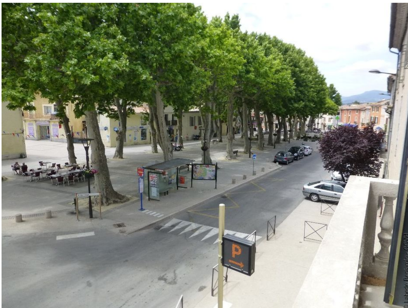
vue extérieure, photo numérique