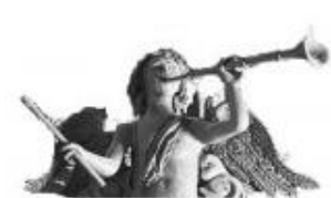
Association des Amis de Saint-Guilhem-le-Désert