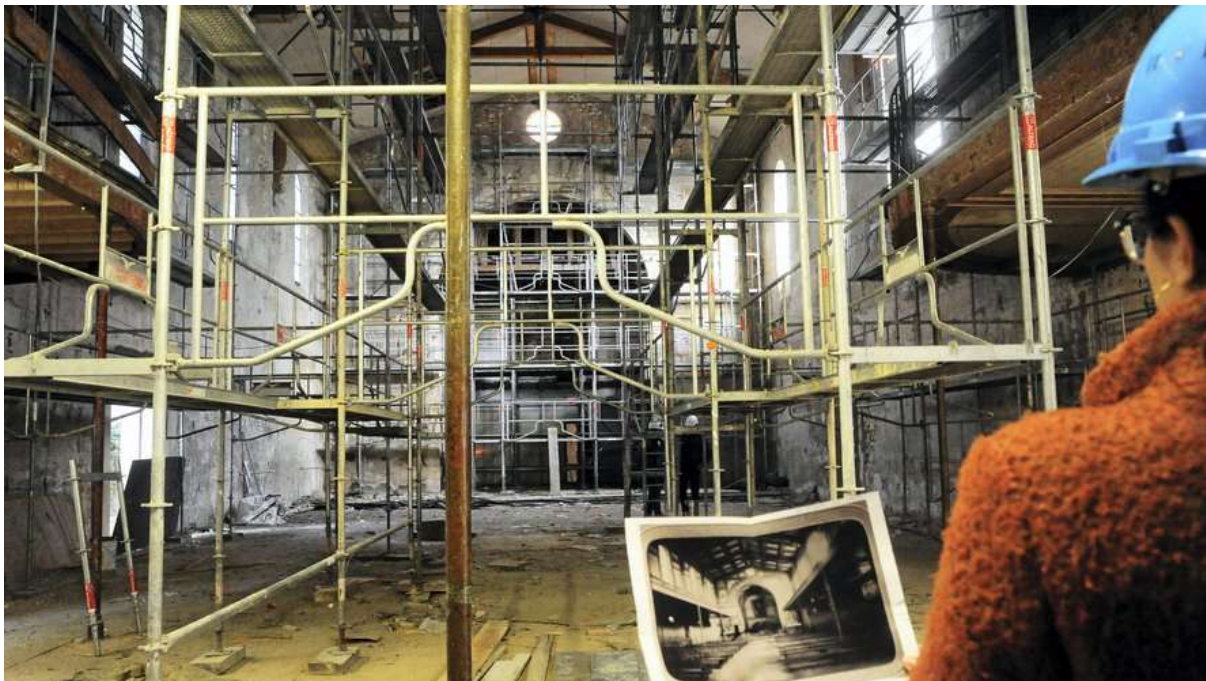
Des documents anciens montrent l'ancienne chapelle érigée au XIXe siècle.